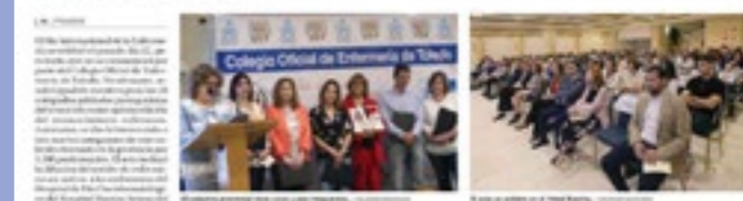
El Colegio de Enfermería de Toledo...