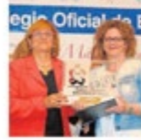
El Colegio Oficial de Enfermería de Toledo...