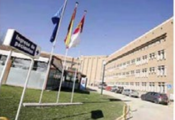
El juez considera la designación como «un acto nulo o anulable» y rescinde.

El magistrado analiza no sólo la Directiva europea sobre cualificaciones profesionales, sino también los artículos de la LOPS que establecen cuáles son las funciones correspondientes a los titulados en Enfermería y en Terapia Ocupacional, y basa el fallo de la sentencia en a comparación de dicha legislación con el texto de la convocatoria en su día realizó el Sescam para aprobar el puesto anulado. Y la conclusión del magistrado es clara: «centrándonos en la convocatoria del puesto de Supervisión de Área de Rehabilitación, Formación, Docencia e Investigación y Recursos Materiales, en el Hospital Nacional de Parapléjicos, dependiente del Sescam, debemos considerar que varias funciones que corresponden al mismo, son las propias de un Diplomado Universitario en Enfermería (titulación que hoy corresponde a la de un Graduado Universitario en Enfermería).