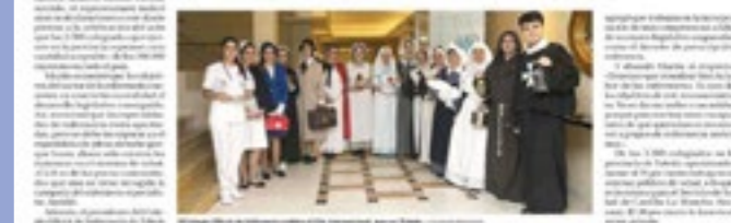
El Colegio de Enfermería de Toledo...

El sector reivindica hacer realidad el desarrollo legislativo conseguido para los enfermeros especialistas. «CLM es de las pocas comunidades que no recoge la categoría», lamentan.