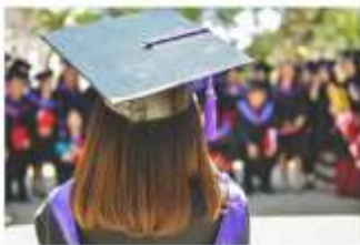
Certificado de Colegiación

Para solicitarlos, debes iniciar sesión o registrarte a continuación.