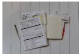
Certificado del Pago de Cuotas