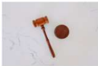
Certificado de Responsabilidad Civil