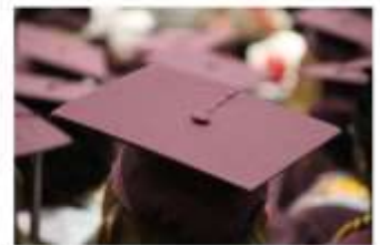
Certificado de Colegiación desde el Extranjero

Una vez pulsado sobre cualquiera de las 4 opciones, el sistema generará el certificado firmado electrónicamente por el Colegio Oficial de Enfermería de Toledo, salvo en el caso del certificado de pago de cuotas, que antes de generarlo, nos permitirá elegir el año correspondiente.