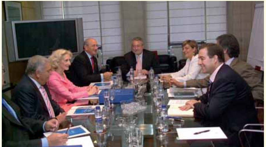
Reunión Enfermería y Sanidad.

Bernat Soria se comprometió a solucionar esta situación de indefensión legal que sufre la profesión enfermera, además de establecer una relación de medicamentos que podrán ser usados o, en su caso, autorizados para los profesionales enfermeros