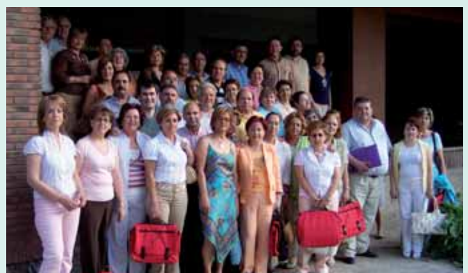
Los alumnos del curso de Nivelación celebrado en Talavera.