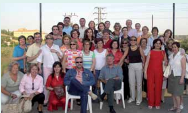
Los alumnos del curso de Nivelación celebrado en Toledo.

El primer bloque ha tratado del marco legislativo y sanitario actual (Ley de Cohesión y Calidad, Ley de Ordenación de las Profesiones Sanitarias, Especialidades, etc.). El segundo bloque ha estado centrado en el desarrollo de la profesión enfermera (competencia profesional, sistemas de normalización y calidad, y riesgos asociados a la práctica profesional); el tercero se ha ocupado de los aspectos psicosociales del ejercicio profesional, y finalmente el cuarto ha presentado la evolución del sistema sanitario y las tendencias existentes en gestión.