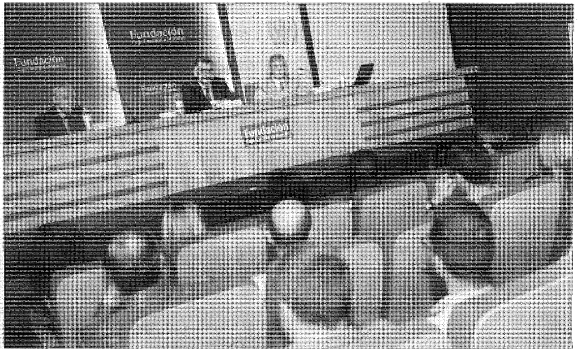
El acto del Día de la Enfermera se celebró en el Palacio de Benacazón.

En este acto, Martín también recordó las reivindicaciones que tiene el colectivo, algunas de las cuales van camino de convertirse en históricas. El Colegio de Enfermería de Toledo sigue preocupado «por el desarrollo profesional definitivo». El presidente hizo hincapié en cómo España «es el país que más desarrollada tiene la enfermería a nivel mundial» con una normativa y una legislación «muy por encima de Estados Unidos» si bien «la tie-