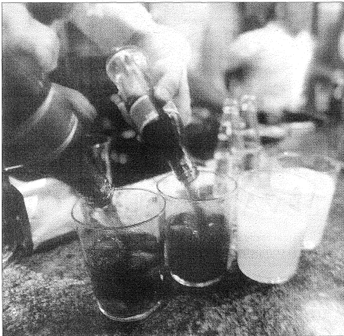
El 20 por ciento de los españoles bebedores ingiere casi el 60 por ciento de todo el alcohol que se consume.

Hoy en día, la ingesta por parte de los adultos en los países occidentales se ha reducido ligeramente en las últimas dos décadas, pero se han visto aumentos en lu-