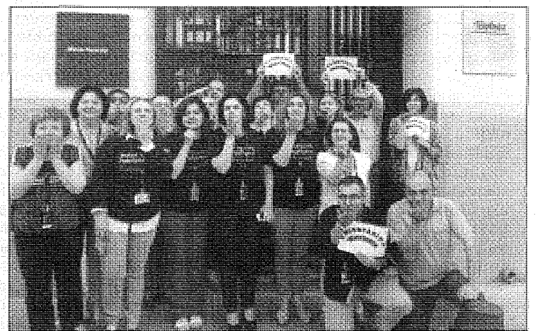
Voluntarios Telefónica de Toledo lanzan un beso a los niños hospitalizados.

SAN JUAN DE DIOS. Aunque el 12 de mayo se celebra el Día Internacional de la Enfermera, los profesionales tienen otra cita importante el día de su patrón, San Juan de Dios, que cada año tiene lugar el 8 de marzo.