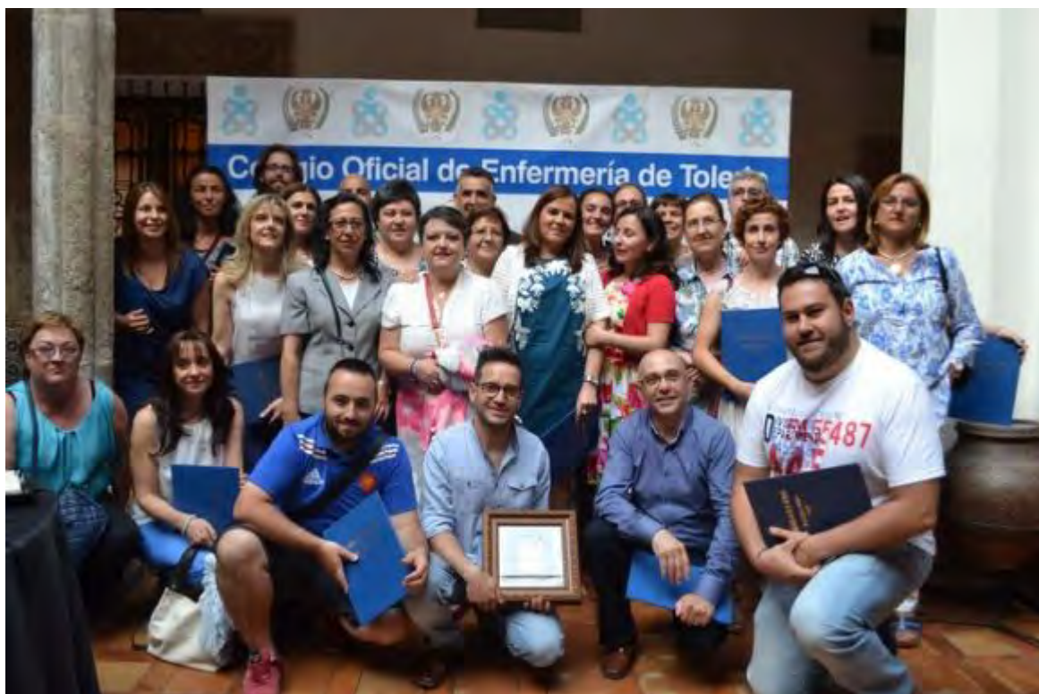
Foto de familia de los galardonados con el presidente del Colegio de Enfermería de Toledo

Más de 100 profesionales de Enfermería de la provincia de Toledo han asistido a la celebración de su Día Internacional organizada por el Colegio Oficial de Enfermería de Toledo, que ha hecho suyo el lema con el que se conmemora este día internacionalmente: "Las Enfermeras: una fuerza para el cambio. Eficaces en cuidados, eficientes en costos".