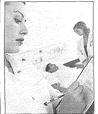
Enfermeras en un hospital.

«Cerca de 388 millones de personas morirán hasta 2025 por una dolencia crónica y España será en 2050 un país muy envejecido», concluyó.