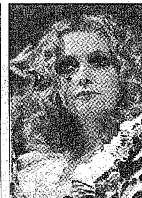
Alison Goldfrapp cantante británica. Nació en 1963.

Nombre y apellidos: _____ Fecha de nacimiento: _____ Calle: _____ Localidad: _____ Nº de suscriptor (si lo es): _____ En cumplimiento con lo dispuesto en la Ley Orgánica 15/1999 de 13 de diciembre, de Protección de datos de carácter personal, se le informa de que los datos personales facilitados por usted vía correo postal o correo electrónico serán susceptibles de tratamiento estrictamente confidencial con la finalidad de prestarle el servicio anunciado, así como de ser incorporados a un fichero cuyo responsable es LA TRIBUNA DE TOLEDO, S.L. (con CIF número B-45810926 y domicilio en Burgos, Av. Castilla y León, 62-64). Por último, se le informa de que tiene el derecho de ejercer por escrito, mediante carta dirigida a la dirección anteriormente indicada, los derechos de acceso, rectificación, cancelación y oposición de sus datos personales. Adjúntenos, junto a este cupón, la fotografía de la persona a la que desea felicitar. Rellene este cupón y envíelo, junto a una fotocopia del DNI, a la sección eHoy felicitamos a... por correo postal a La Tribuna, Cuesta de Carlos V, nº 5, 2ª planta. 45001 Toledo por correo electrónico a lectorestoledo@diariolatribuna.com y también a Barrio de San Juan, 25 Entreplanta. Código Postal 45.600 Talavera de la Reina.