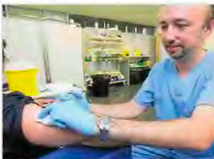
Los enfermeros podrán prescribir medicamentos.