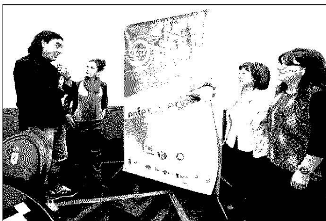
La alcaldesa acudió a la presentación de las jornadas.

Antes del inicio de las jornadas, ayer se desarrolló un taller de soporte vital básico y Desat en el polideportivo de Villafranca del Bierzo, en el que participaron un buen número de profesionales de enfermería. La jornada del día 9 se iniciará a las diez de la mañana en el Teatro Villafranquino, donde se desarrollarán parte de las actividades, con la ponencia «Aprendamos de la Experiencia» en la