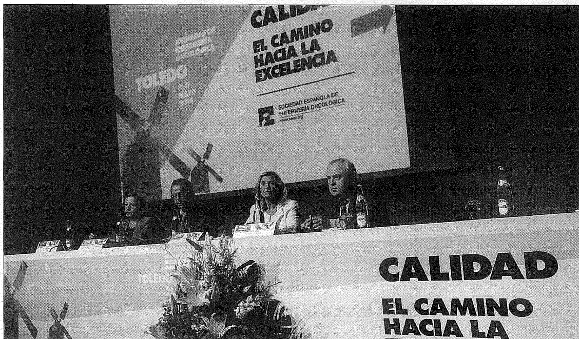
La jornada se inauguró en la tarde de ayer en el Hotel Beatriz. / VÍCTOR BALLESTEROS