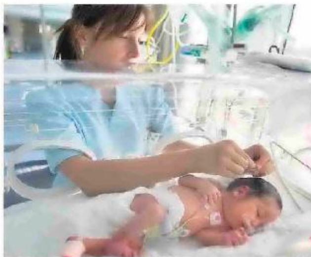
Los enfermeros españoles están muy valorados en Europa.

Destino Lengua, empresa especializada en formación y empleo ofrece la oportunidad, en colaboración con la Cámara de Comercio de Sevilla de participar en diferentes procesos de selección para cubrir puestos en Alemania. Se ofrece a los interesados formación en lengua alemana de tres meses en España mediante un curso gratuito, el viaje a ese país pagado, formación gratuita en lengua alemana de dos a tres meses ya en destino hasta alcanzar el nivel B2 requerido (curso gratuito, vivida también gratuita en la fase de formación en Alemania (incluidos gastos de luz, calefacción, wifi, etc.), manteni-