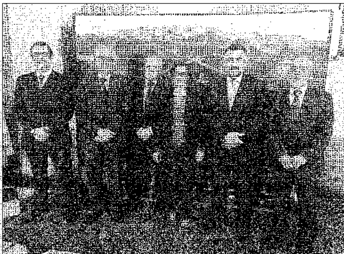
Foto de familia antes de la cena del patrón en el restaurante 'Olrey', y el paro

«Enfermería es la profesión que más está sufriendo», señaló con gran preocupación porque considera que este año no será más halagüeño que 2013. Al Colegio de Enfermería le preocupa fundamentalmente el desempleo y Martín echó mano de las cifras para ilustrar un problema que afecta especialmente a esta comunidad autónoma. «Hay más de 3.500 enfermeros en paro absoluto en la provincia de Toledo», sostuvo y recordó que la situación se agrava de año en año porque los nuevos diplomados universitarios pasan directamente a engrosar las listas del paro.